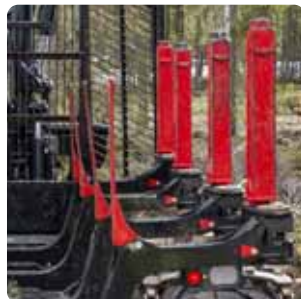
Séparez les grumes à l'aide de barre de séparation (option)