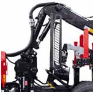
Grille à déplacement hydraulique (option)