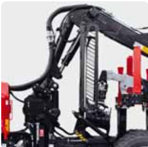
Grille à déplacement hydraulique (option)