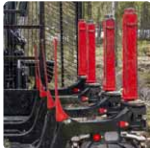
Séparez les grumes à l'aide de barre de séparation (option)